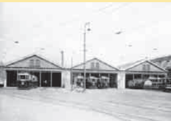
Přibližně ze stejné doby jako předchozí snímek pochází i fotografie vozovny. Měla tři lože po pěti kolejích. Vozovna zahájila provoz 2. července 1900.