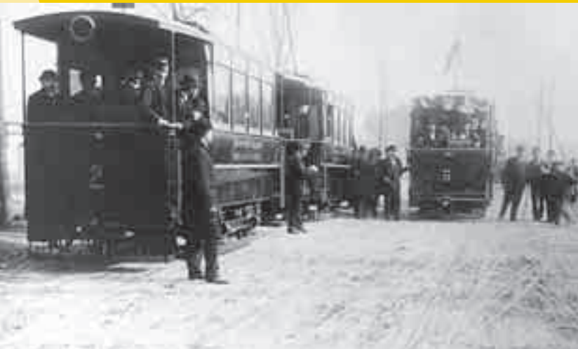
Slavnostní zahájení provozu na elektrické dráze Praha – Libeň – Vysočany 19. března 1896 na Balabence. Události bylo přítomno hned několik fotografů.