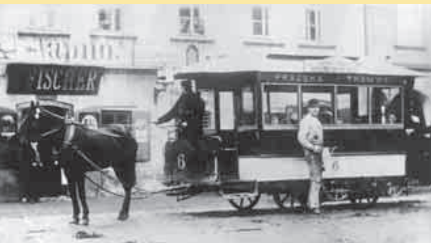
Jeden z neznámějších snímků pražské koňky – zavřený vůz číslo 6 na konečné v Karlíně v roce 1883.