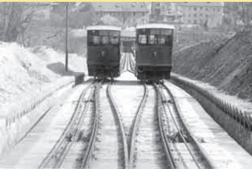
Lanová dráha na Petřín. Tato fotografie byla pořízena zřejmě v roce 1914 nebo snad dokonce až po válce, protože byla pravděpodobně zhotovena z filmového záběru.

Druhou pozemní lanovou dráhu vybudovalo v Praze Družstvo rozhledny na Petříně, aby usnadnilo cestování návštěvníků rozhledny. Vlastníkem koncese ale bylo hlavní město Praha. Proti dnešní lanové dráze byla původní trať z roku 1891 kratší (396,47 m; neprocházela Hladovou zdí), měla rozchod 1 000 mm a na rozdíl od letenské lanovky byla tříkolejnicová s výhybnou uprostřed. I zde byl zajišťován provoz systémem vodní převahy. Provoz byl zahájen 25. července 1891 a přerušen byl v roce 1914 v důsledku vypuknutí světové války. V té době byla lanovka stále samostatným dopravním podnikem provozovaným Družstvem rozhledny na Petříně. V letech 1919 a 1920 byla dráha v provozu, ale pro potíže s dodávkami vody se už v roce 1921 pravděpodobně vůbec nejezdilo. Teprve s blížícím se sokolským sletem připravovaným na rok 1932 byly podniknuty kroky k rekonstrukci lanovky. Městská rada 2. března 1931 převedla neprovozovanou petřínskou lanovou dráhu do majetku Elektrických podniků, čímž definitivně skončila existence této dráhy coby samostatného dopravního podniku.