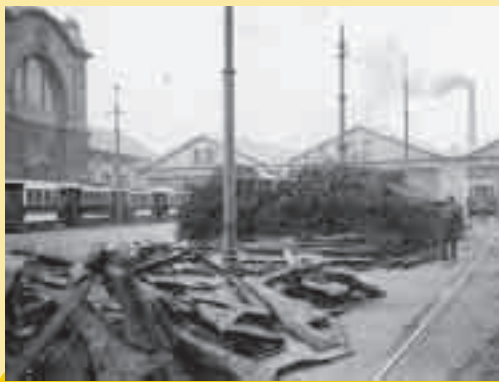
Jiný snímek A. Novotného 19. března 1914 ukazuje dvůr doslova obložený demontovanými součástmi ochranných rámu systému Svoboda-Jirgl-Charvát a podvozků typu maximum traction.