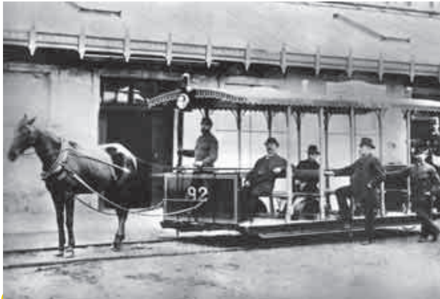
Koněspřežná tramvaj, která v poslední čtvrtině 19. století bývala charakteristickým dopravním prostředkem hlavních pražských ulic, se nám dnes logicky zdá primitivní. Ve vozovém parku (nikoliv ale od počátku) bychom našli i otevřené vozy. Možná bychom je dnes označili za nízkopodlažní, ale nesmíme zapomenout, že teprve během první světové války se objevily první nástupní ostrůvky.

Pražané se každý den setkávají s pražskými dopravy. Většinou to jsou řidiči tramvají a autobusů, o něco méně jsou vidět strojevedoucí metra. Cestující potkávají také dozorců v metru, navštěvují pracovníky středisek dopravních informací. Ale už nepotkávají například pracovníky dílen, výpravčí ve vozovkách a většinou ani dis-