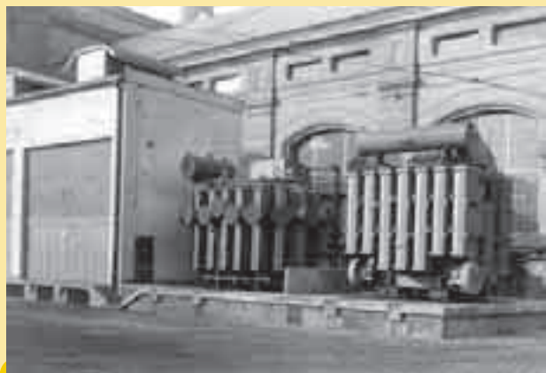
Transformátory po instalaci na rampě před strojovnou v roce 1934. Vlevo jsou další transformátorové kobky.