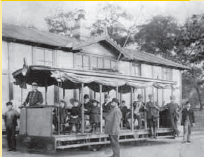
Vůz Elektrické dráhy na Letné v Praze v červenci 1891 před strojovnou, ve které byl poprvé pro pražské tramvaje vyráběn elektrický proud.

Průkopnická trať Františka Křížíka byla nejen první elektrickou dráhou v Praze, ale v českých zemích vůbec. Byla také první elektrickou dráhou s vrchním vedením v Rakousku. Křížík dráhu postavil k propagačním účelům při příležitosti Zemské jubilejní výstavy, která se v Praze uskutečnila v roce 1891. Jediná trať Křížíkova soukromého dopravního podniku, označovaného v úředních materiálech názvem Elektrická dráha na Letné v Praze, měřila necelých 800 metrů a vedla od Letenské restaurace Ovencekova ulicí ke vchodu do Královské obory. Provoz byl na ní zahájen 18. července 1891. Křížík měl původně koncesi jen na dobu trvání výstavy. Aby mohl jezdit i v roce 1892, musel znovu úřady požádat o povolení. S ohledem na nepříliš výhodnou polohu, předurčující spíše rekreační charakter provozu, Křížík na trati udržoval jen sezónní provoz. V roce 1893 trať prodloužil k Místodržitelství letohrádku na celkovou délku 1,4 km. V pozdějších letech měl v úmyslu trať prodloužit, například na Malou Stranu, do Rostok či alespoň do Bubenče. Elektrická dráha na Letné v Praze měla také tzv. kombinované jízdenky platné i na lanové dráze. Vznikl tak na čas první integrovaný dopravní systém. Dráha byla naposledy v provozu v létě 1900, 15. srpna byl provoz dočasně zastaven, ale již nebyl obnoven. Dopravní podnik Elektrická dráha na Letné v Praze byla nabídnuta Elektrickým podnikům královského hl. m. Prahy, ty o ni ale neměly zájem, a tak první česká elektrická dráha definitivně zanikla.