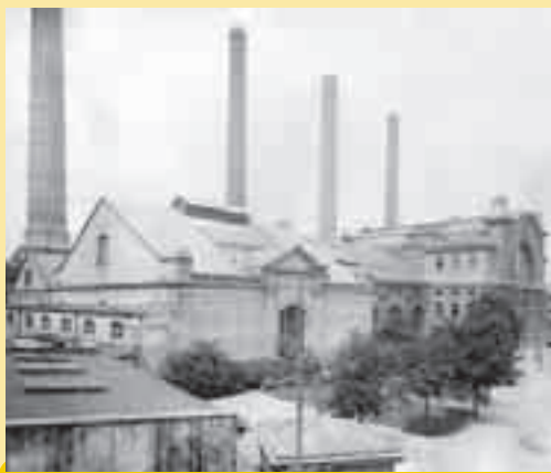
Celek nádvoří holešovické elektrárny v první polovině 20. let 20. století. Dominantním objektem byla vlastní elektrárna, tj. kotelna se čtyřmi komíny a strojovna, ve které byla i výroba trakčního proudu.