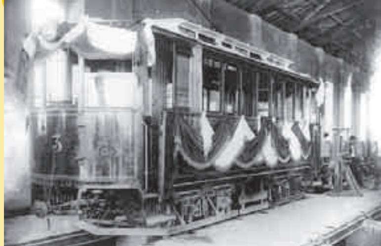
Motorový vůz č. 3 Městské elektrické dráhy Královských Vinohrad ve vozovně, zřejmě po skončení slavnostního zahájení provozu 25. června 1897.

O organizačním začlenění vinohradské dráhy je k dispozici jen málo informací. Na jízdenkách a v některých úředních spisech má podnik označení Městská elektrická dráha Král. Vinohrady, někdy také Městská elektrická dráha Královských Vinohrad. Na vozích byl prostý nápis Král. Vinohrady. Jaká byla případná vazba na Elektrický podnik Královských Vinohrad, který provozoval vinohradskou městskou elektrárnu, kterou převzaly Elektrické podniky až v roce 1922, není zatím známo. Městská elektrická dráha Královských Vinohrad byla v pražské aglomeraci tramvajovým dopravním podnikem s nejkratší existencí – pouhé tři měsíce.