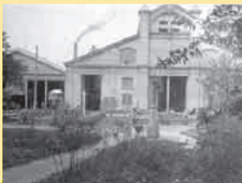
A ještě jeden snímek A. Novotného. Budova ústředních tramvajových dílen v roce 1914 krátce před jejich stěhováním. Vraty vlevo, vedle vozovny, vedla kolej do lakovny. Dvojičí vrat uprostřed dílen vedly dvě koleje do vlastní opravy tramvají.