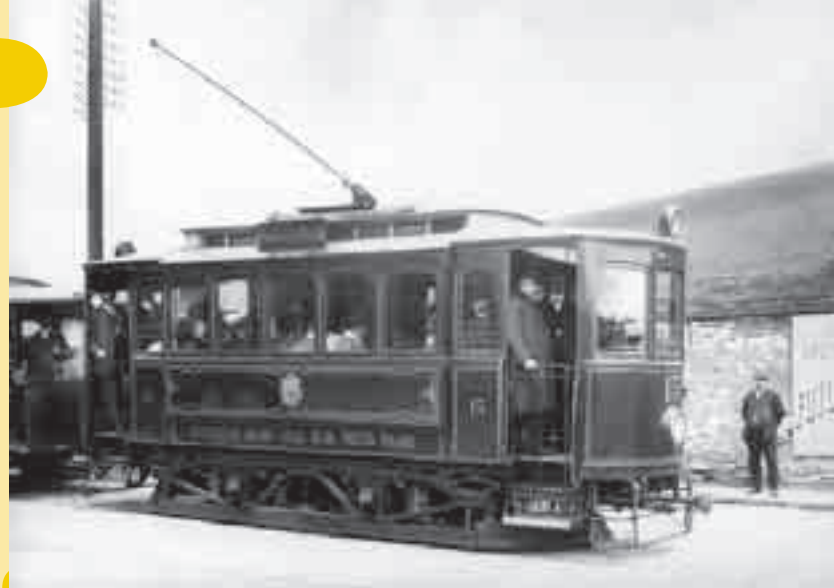
Další známý snímek – motorový vůz Elektrických podniků č. 15 v roce 1907 (nejpozději na počátku roku 1908) nasazený již na lince z Florence do Vysočan. Dnes už se zřejmě nedozvíme, zda fotograf zachytil tento vůz na Palmovce cílevědomě, aby tak dokumentoval převzetí libeňské dráhy Elektrickými podniky a dovršení městského monopolu nad tramvajovou dopravou.