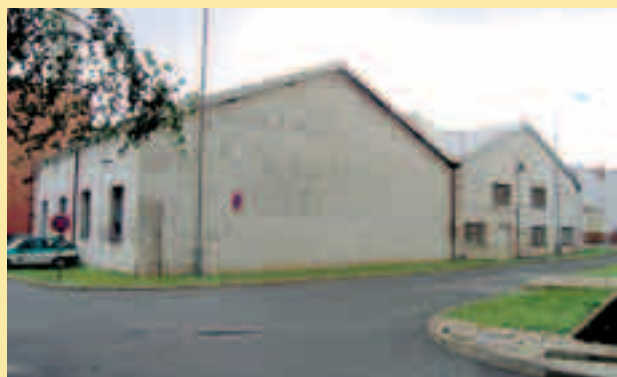
A tak vypadala někdejší tramvajová vozovna Centrála 31. května 2005. V roce 1977 byla část vozovny zbořena, aby ustoupila výškové administrativní budově. Dodnes zbyly jen části první a druhé lože.