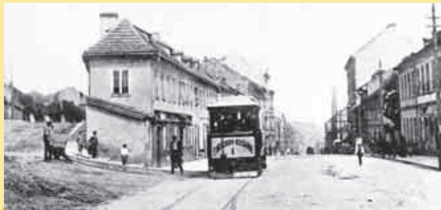
Vůz Elektrické dráhy Smíchov – Košíře na křižovatce Holečkovy a Plzeňské ulice. Domy na snímku už neexistují.