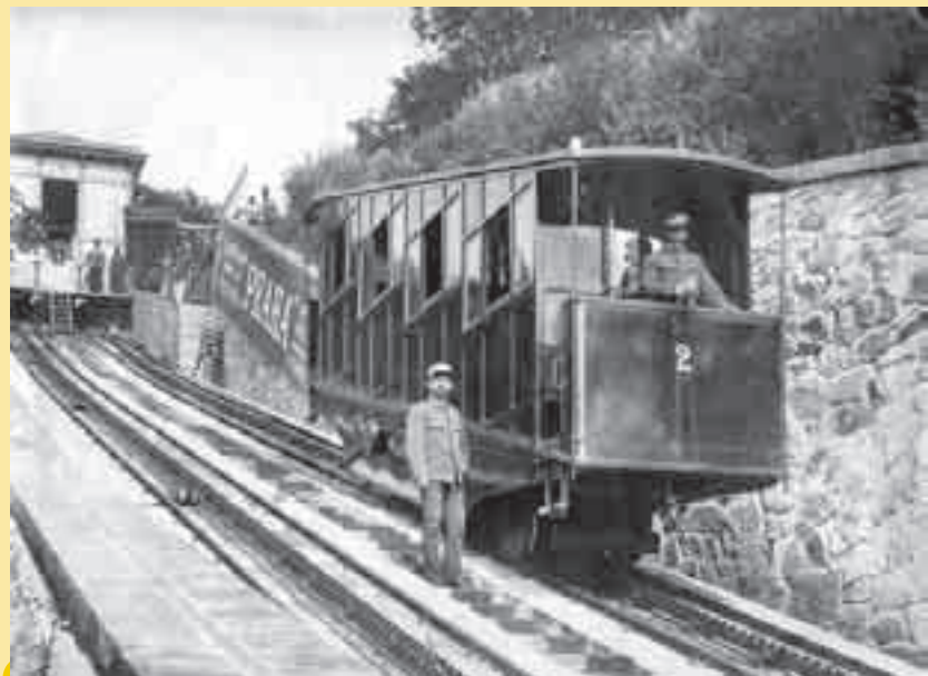
A další klasický snímek – letenská lanovka v roce 1891.

Při příležitosti Zemské jubilejní výstavy byla pražskou obcí postavena a 31. května 1891 uvedena do provozu pozemní lanová dráha na Letnou. Vedla od dnešního ústí Letenského tunelu k Letenské restauraci, kde měla později vazbu na Křížíkovu elektrickou dráhu. Dráha byla v celém průběhu dvoukolejná, úzkorozchodná (1 000 mm), dosahovala šikmé délky 109 m a překonávala výškový rozdíl 38,28 m. Základní sklon tratě byl 330 ‰. Provoz byl zajišťován na principu vodní převahy. Dráhu spravovala vlastní správní rada, a proto se jednalo o samostatný dopravní podnik. Teprve od 1. ledna 1900 byla lanovka převedena do majetku Elektrických podniků, které zadaly její elektrifikaci Františku Křížíkovi. Provoz letenské lanovky byl ukončen 10. listopadu 1916 a už nebyl nikdy obnoven.